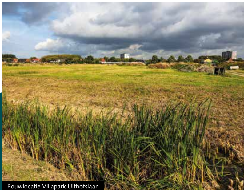
Bouwlocatie Villapark Uithofslaan