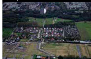
Villapark Uithofslaan vanuit de lucht