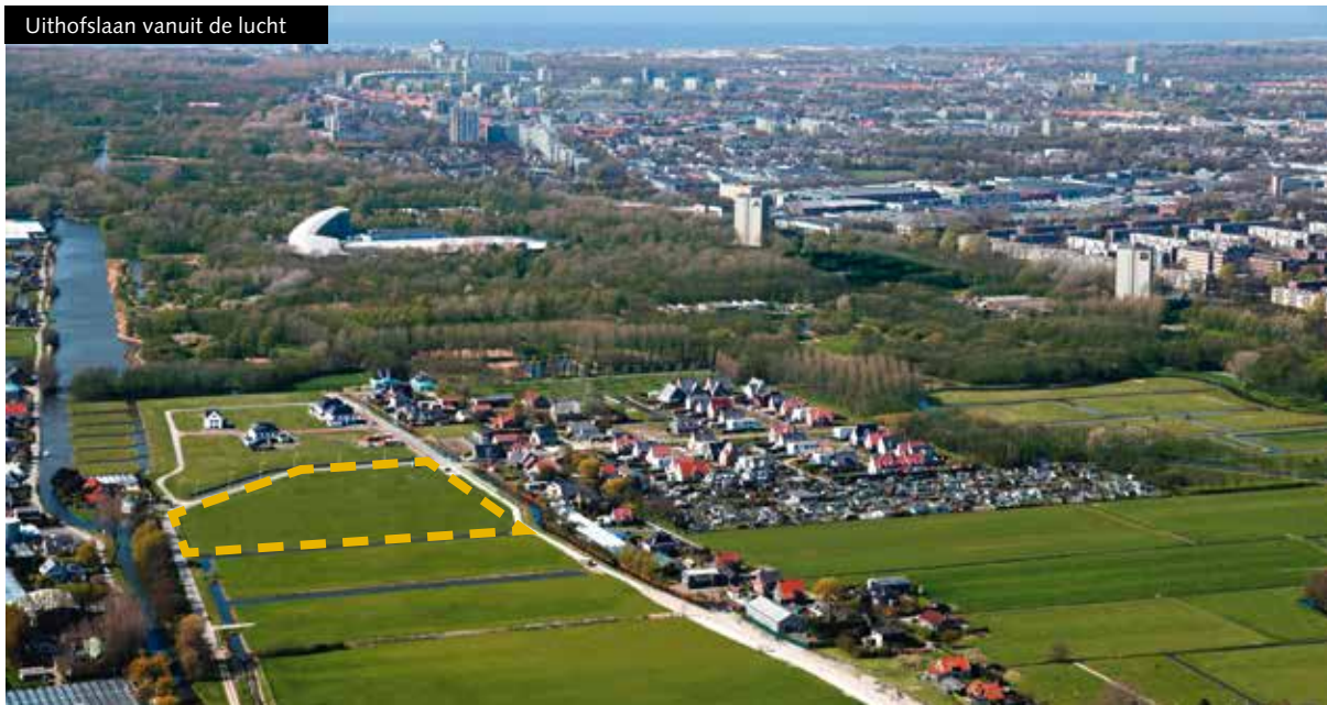
Uithofslaan vanuit de lucht