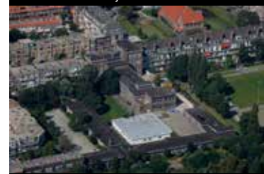
Mient vanuit de lucht