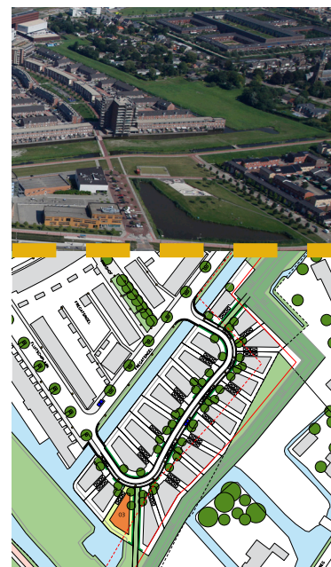
Afmetingen van kavelplattegrond in meters.