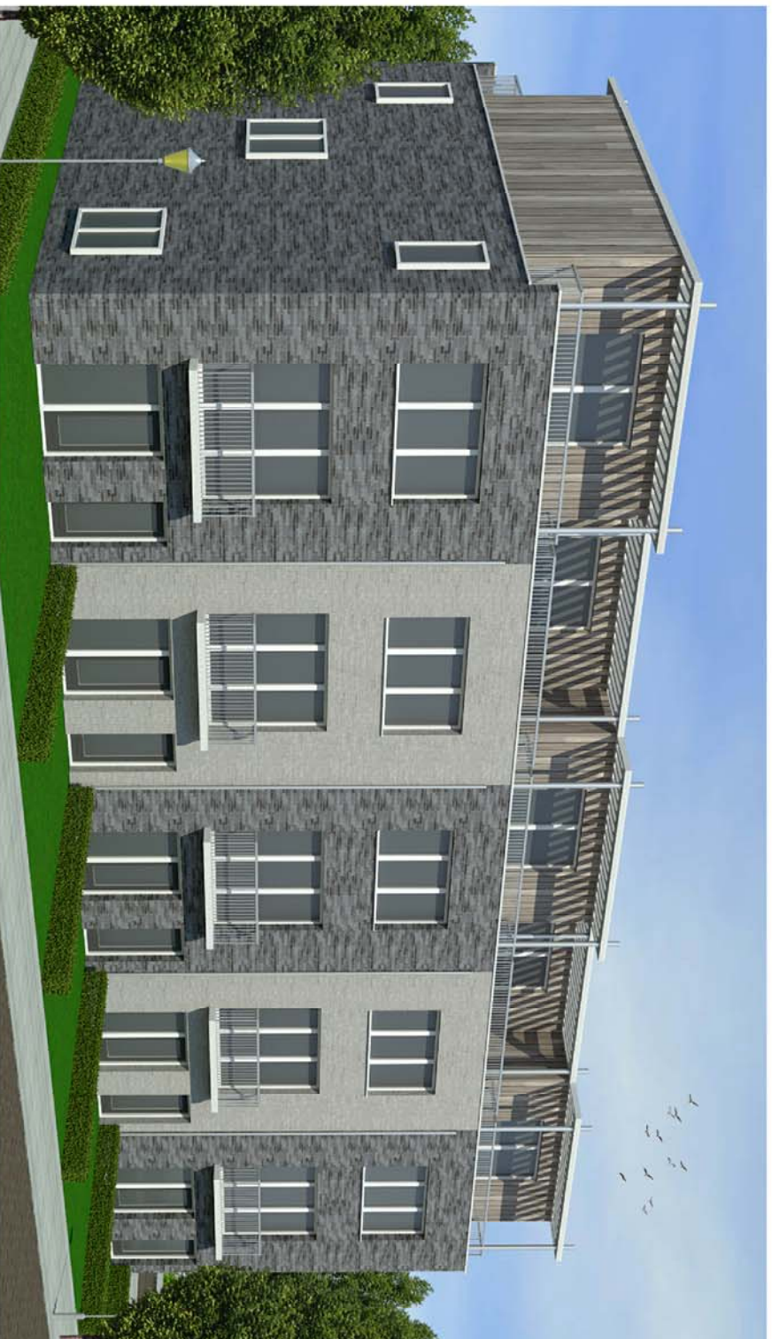
voorgevel - straatzijde

Deze materialen en kleuren kunnen in overleg naar uw smaak aangepast worden. Deze typologie kan ook op and kavels worden aangeboden.