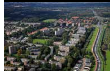
Isabellaland vanuit de lucht