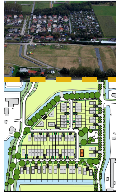
Afmetingen van kavelpatting in meters.