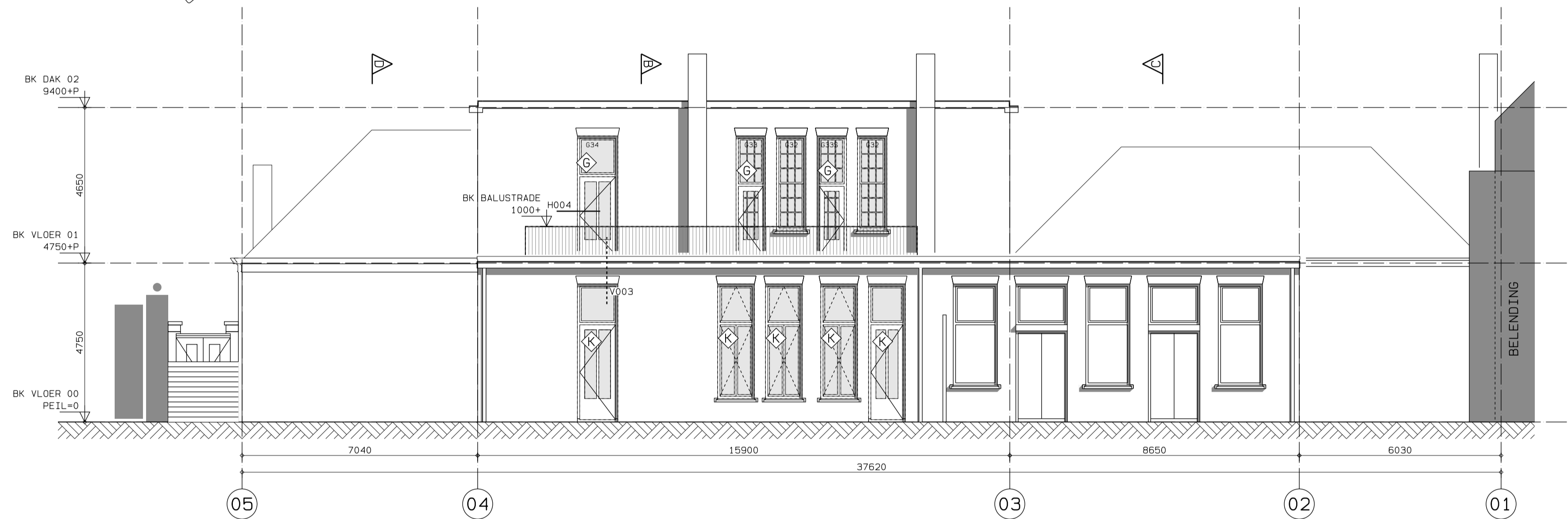
GEVEL ZUID - NIEUW