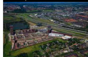
Fregatsingel vanuit de lucht