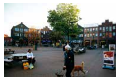
Nootdorp - De Parade

De Fregatsingel behoort tot de groene rand van dijken en tussenboezems die om de Ypenburgse deelwijk De Caaïen ligt. Een deel ervan wordt bebouwd. Het nieuwe woonwijkje ligt tussen de singel en een dijkje. Twee bruggen ontsluiten de buurt. Ruime kavels met uiteenlopende vormen die inspireren tot bijzondere woningontwerpen. Een auto-luwe wijk, rustig, landelijk, vrij én hoogwaardig. Eén stap buiten de deur begint de polder. Wandelen, spelen en ontdekken, water, riet en weide. Fruitbomen en dijken bezaaid met kruiden. Ook dichtbij: de vele faciliteiten en mogelijkheden van de 'grote' stad. Scholen, zoals de British School, winkel- en gezondheidscentra en sportvoorzieningen. Het Hofbad - het enige overdekte 50-meter wedstrijdabad in de regio - is om de hoek. De automobilist rijdt vanuit Ypenburg gemakkelijk de A4, de A12 en de A13 op. NS-station Den Haag Ypenburg is op loopafstand en Randstadrail 3 brengt u naar onder andere Den Haag Centrum.